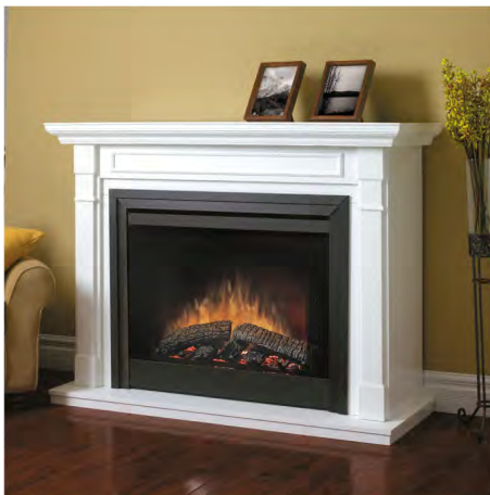
Mueble blanco BC3336W2 Chimenea BF33DXP Kit perimetral negro BFKIT33BLK y Vidrio plano BFGLOSS39BLK