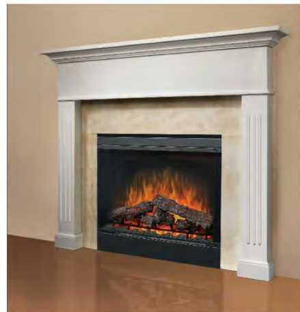
Moldura de sobreponer con interior en mármol crema BM33CM con Chimenea Purifire BF33DXP