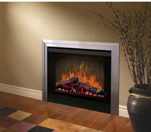
Chimenea BF39DXP con Kit perimetral de acero inoxidable BFKIT39SS y Vidrio plano BFGLOSS39BLK